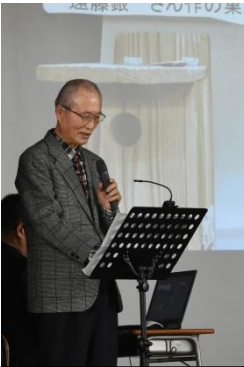
巣箱作りの思い出