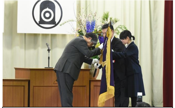
校旗返納 校長・生徒会長から教育長へ

～生徒代表あいさつ～ 「引き継ぎ白川魂 そして明日へ未来へ」 をスローガンに、この 白川中学校で学んだこ とを忘れず、若竹のよ うに真っ直ぐな気持ち をもって、次のステー ジで新たな伝統を作り 上げていきたいと思ひ ます。