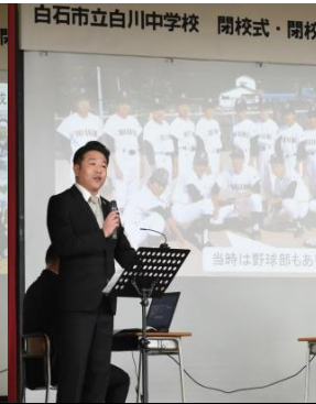
学校生活について