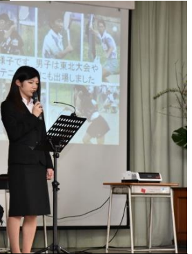
ソフトテニスの思い出