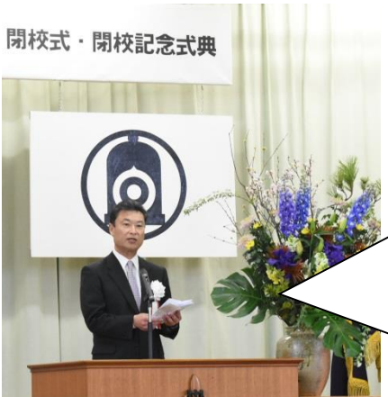
閉校式・閉校記念式典

～校長あいさつ～ どんな困難にも屈することなく、夢に向かい志高く邁進してきた「白川魂」の精神を今後は1・2年生は東中学校で、3年生は進学先の高校生活に反映していくとともに、輝かしい未来への活力にしていくことを期待しています。