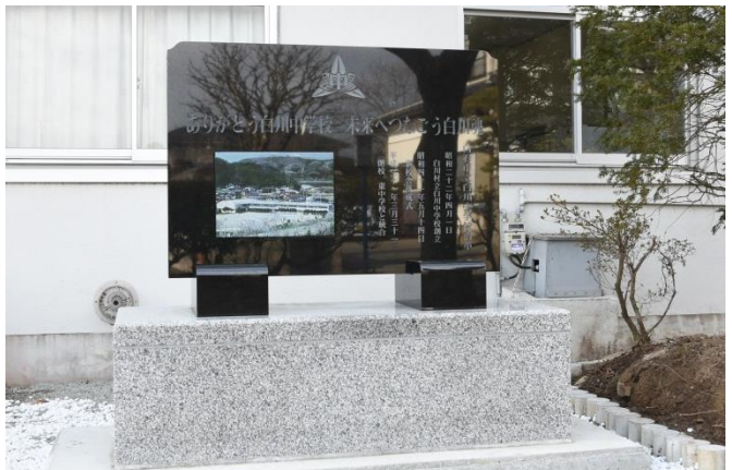
「ありがとう白川中学校 未来へつなごう白川魂」という言葉と校舎のカラー写真が刻まれた記念碑