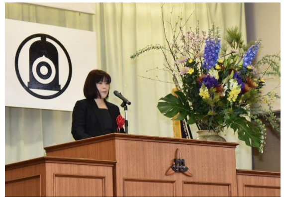
白川中学校父母教師会会長のあいさつ

～校長あいさつ～ どんな困難にも屈することなく、夢に向かい志高く邁進してきた「白川魂」の精神を今後は1・2年生は東中学校で、3年生は進学先の高校生活に反映していくとともに、輝かしい未来への活力にしていくことを期待しています。