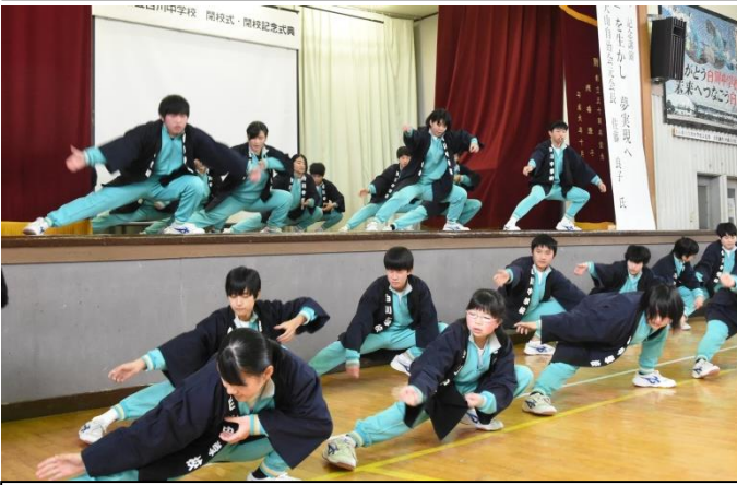
～オープニング～在校生27名による白川ソーラン