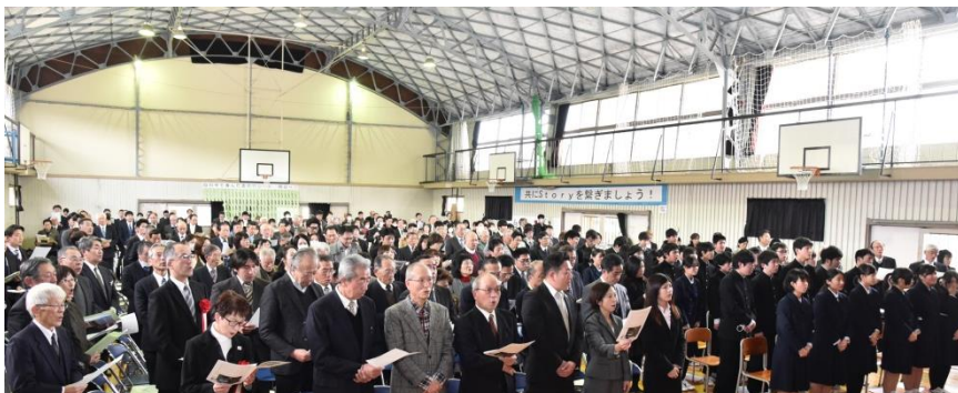
全員合唱「ふるさと」。会場の皆様の心が一つになりました。