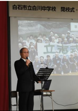
立志登山講師として